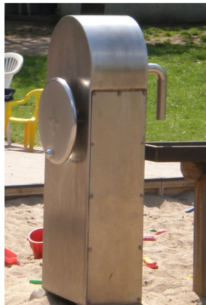
Ausführung mit verlängertem Auslauf

Diese Zeichnung ist Eigentum der Firma: ESF Emsland Spiel- und Freizeitgeräte GmbH & Co. KG Thyssenstraße 7, 49744 Geeste Tel: 0 59 37/ 97 189 0 ; Fax: 0 59 37/ 97 189 90 Alle Rechte sind bei den Autoren. Diese Unterlage darf nicht ohne Zustimmung der Fa. Kinderland Emsland Spielgeräte in den Ausschreibungen verwendet werden. Der nicht autorisierte Nachbau ist kostenpflichtig.